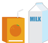
IPU MIRAKA & IPU WAIRANU